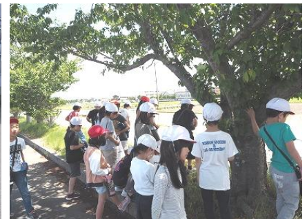
【3年生：ハートプラザにて】