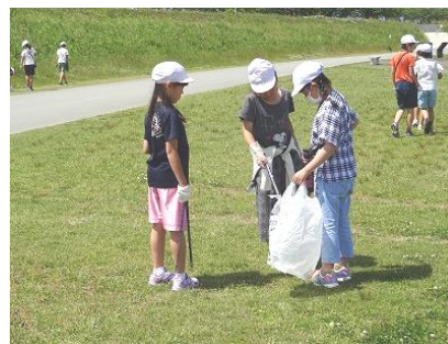
【5年生：ラブリバー公園にて】