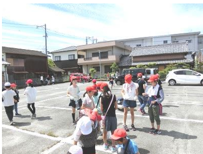
【4年生：御園総合支所にて】