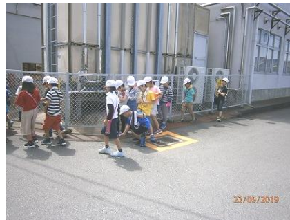
【2年生：小学校周辺にて】